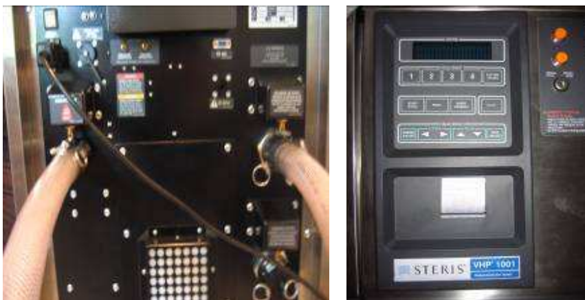
Rys 5. Jednostka bio-dekontaminacyjna STERIS VHP – widok od tyłu. Węże wlotowe/wylotowe.

Mikroprocesorowy układ sterujący VHP1001 Eagle oraz drukarka