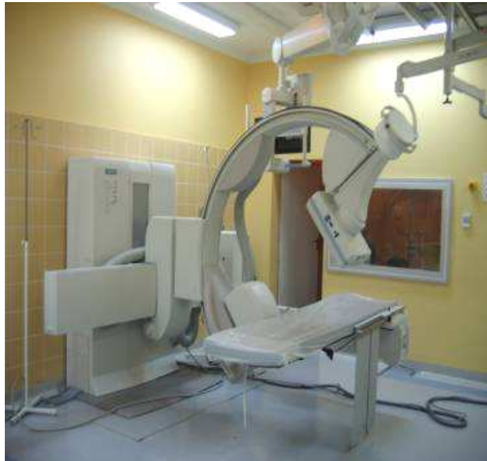
Rys. 2. Przygotowanie pracowni przed rozpoczęciem cyklu dekontaminacyjnego VHP